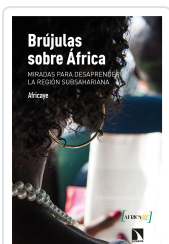
BRÚJULAS SOBRE ÁFRICA AFRICAYE