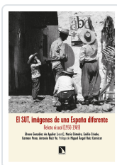
EL SUT, IMÁGENES DE UNA ESPAÑA DIFERENTE GONZÁLEZ DE AGUILAR, ÁLVARO