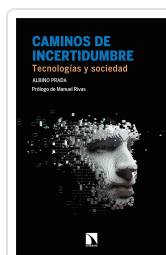
CAMINOS DE INCERTIDUMBRE PRADA, ALBINO