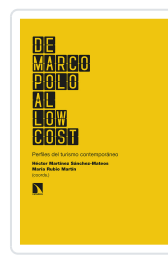
DE MARCO POLO AL LOW COST MARTÍNEZ SÁNCHEZ-MATEOS, HÉCTOR/RUBIO MARTÍN, MARÍA