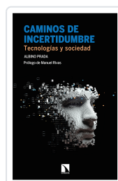
CAMINOS DE INCERTIDUMBRE PRADA, ALBINO