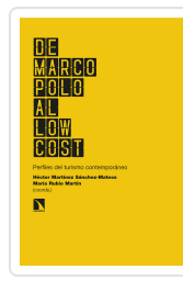
DE MARCO POLO AL LOW COST MARTÍNEZ SÁNCHEZ-MATEOS, HÉCTOR/RUBIO MARTÍN, MARÍA