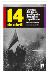
14 DE ABRIL CLAVERO MARTÍN, VICENTE