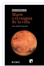
MARTE Y EL ENIGMA DE LA VIDA ÁNGEL VAQUERIZO, JUAN