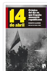
14 DE ABRIL CLAVERO MARTÍN, VICENTE