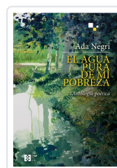
EL AGUA PURA DE MI POBREZA NEGRI, ADA