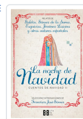
LA NOCHE DE NAVIDAD. CUENTOS DE NAVIDAD II GÓMEZ FERNÁNDEZ, FRANCISCO JOSÉ