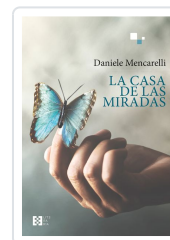
LA CASA DE LAS MIRADAS DANIELE MENCARELLI