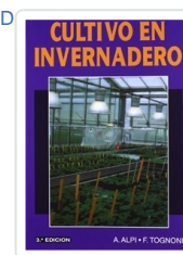
CULTIVO EN INVERNADERO ALPI, A.; TOGNONI, F.