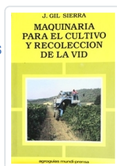
MAQUINARIA PARA EL CULTIVO Y RECOLECCIÓN DE LA VID GIL SIERRA, J.M.