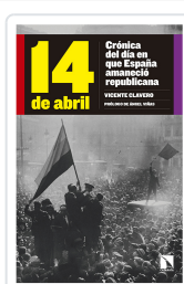
14 DE ABRIL CLAVERO MARTÍN, VICENTE