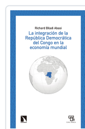
LA ECONOMÍA DE LA REPÚBLICA DEMOCRÁTICA DEL CONGO BILADI ABASI, RICHARD