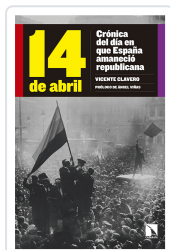
14 DE ABRIL CLAVERO MARTÍN, VICENTE