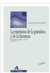
LA ENSEÑANZA DE LA GRAMÁTICA Y DE LA LITERATURA FERNÁNDEZ RAMÍREZ, SALVADOR