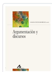
ARGUMENTACIÓN Y DISCURSOS VV.AA