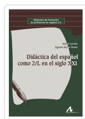
DIDÁCTICA DEL ESPAÑOL COMO 2/L EN EL SIGLO XXI LACORTE, MANEL