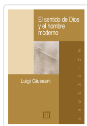
EL SENTIDO DE DIOS Y EL HOMBRE MODERNO GIUSSANI, LUIGI