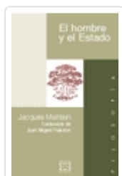
EL HOMBRE Y EL ESTADO JACQUES MARITAIN