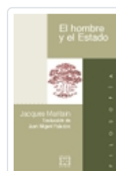
EL HOMBRE Y EL ESTADO JACQUES MARITAIN