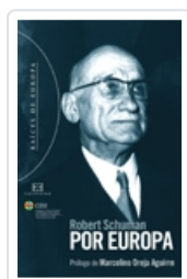
POR EUROPA ENCUENTRO