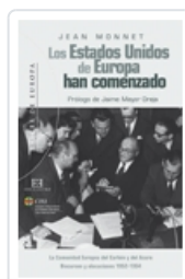
LOS ESTADOS UNIDOS DE EUROPA HAN COMENZADO ENCUENTRO