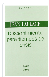
DISCERNIMIENTO PARA TIEMPOS DE CRISIS JEAN LAPLACE