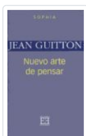
NUEVO ARTE DE PENSAR JEAN GUITTON