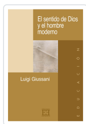
EL SENTIDO DE DIOS Y EL HOMBRE MODERNO GIUSSANI, LUIGI