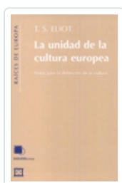
LA UNIDAD DE LA CULTURA EUROPEA ELIOT