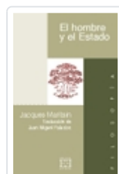
EL HOMBRE Y EL ESTADO JACQUES MARITAIN