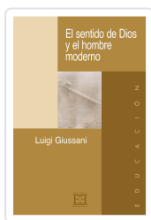
EL SENTIDO DE DIOS Y EL HOMBRE MODERNO GIUSSANI, LUIGI