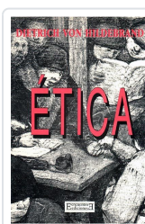
ÉTICA HILDEBRAND, DIETRICH VON