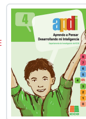
APDI 4 PARA 4º PRIMARIA ICCE - VV.AA.