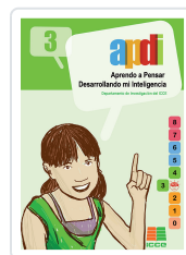
APDI 3 PARA 3º PRIMARIA ICCE - DEPARTAMENTO DE INVESTIGACION ICCE