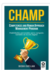
CHAMP CUÉLLAR, DIEGO