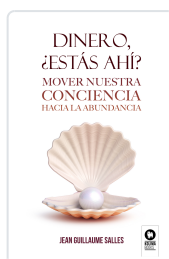
DINERO, ¿ESTÁS AHÍ? SALLES, JEAN GUILLAUME