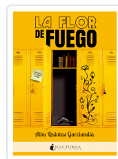
LA FLOR DE FUEGO QUINTAS GARCÍANDIA, ALBA