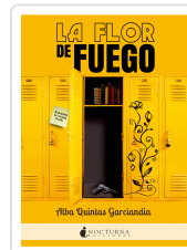
LA FLOR DE FUEGO QUINTAS GARCÍANDIA, ALBA