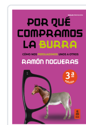
POR QUÉ COMPRAMOS LA BURRA NOGUERAS PÉREZ, RAMÓN