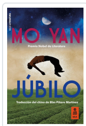
JÚBILO YAN, MO