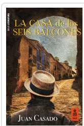
LA CASA DE LOS SEIS BALCONES CASADO FLORES, JUAN