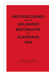
INSTRUCCIONES PARA LOS SOLDADOS BRITANICOS EN ALEMANIA, 1944 MINISTERIO DE ASUNTOS EXTERIORES