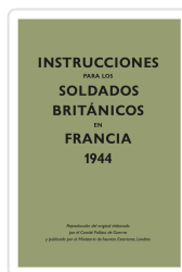
INSTRUCCIONES PARA LOS SOLDADOS BRITANICOS EN FRANCIA, 1944 MINISTERIO DE ASUNTOS EXTERIORES