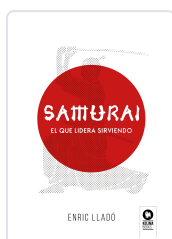
SAMURAI LLADÓ MICHELI, ENRIC