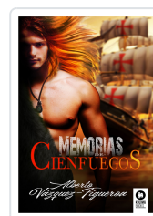
MEMORIAS DE CIENFUEGOS VÁZQUEZ-FIGUEROA, ALBERTO