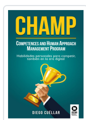
CHAMP CUÉLLAR, DIEGO