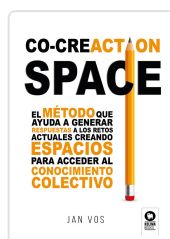
CO-CREATION SPACE VOS, JAN