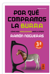
POR QUÉ COMPRAMOS LA BURRA NOGUERAS PÉREZ, RAMÓN