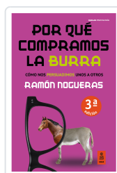
POR QUÉ COMPRAMOS LA BURRA NOGUERAS PÉREZ, RAMÓN