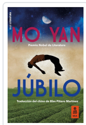
JÚBILO YAN, MO