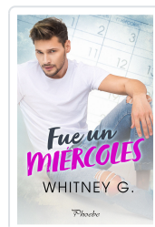
FUE UN MIÉRCOLES G., WHITNEY