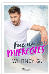
FUE UN MIÉRCOLES G., WHITNEY