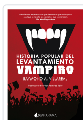
HISTORIA POPULAR DEL LEVANTAMIENTO VAMPIRO VILLAREAL, RAYMOND A.