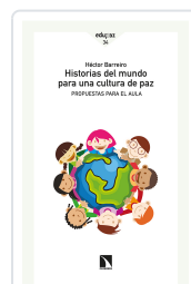
HISTORIAS DEL MUNDO PARA UNA CULTURA DE PAZ BARREIRO, HÉCTOR