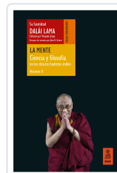
LA MENTE (CIENCIA Y FILOSOFÍA EN LOS CLÁSICOS BUDISTAS INDIOS, VOL. II) LAMA, DALAI