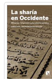
LA SHARÍA EN OCCIDENTE BACKENKÖHLER CASAJÚS, CHRISTIAN J.