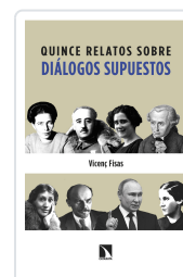
QUINCE RELATOS SOBRE DIÁLOGOS SUPUESTOS FISAS ARMENGOL, VICENÇ