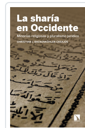
LA SHARÍA EN OCCIDENTE BACKENKÖHLER, CASAJUS, CHRISTIAN J.