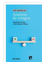
ANÁLISIS DE RIESGOS RÍOS INSUA, DAVID/NAVEIRO FLORES, ROI