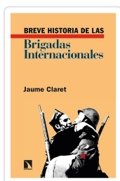
BREVE HISTORIA DE LAS BRIGADAS INTERNACIONALES CLARET, JAUME