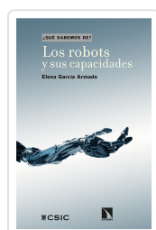
LOS ROBOTS Y SUS CAPACIDADES GARCÍA ARMADA, ELENA