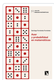
AZAR Y PROBABILIDAD EN MATEMÁTICAS FERNÁNDEZ FERNÁNDEZ, SANTIAGO