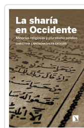
LA SHARÍA EN OCCIDENTE BACKENKÖHLER CASAJUS, CHRISTIAN J.