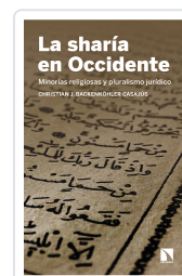
LA SHARÍA EN OCCIDENTE BACKENKÖHLER CASAJUS, CHRISTIAN J.