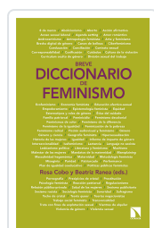
BREVE DICCIONARIO DE FEMINISMO COBO BEDIA, ROSA / RANEA TRIVIÑO, BEATRIZ