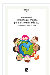
HISTORIAS DEL MUNDO PARA UNA CULTURA DE PAZ BARREIRO, HÉCTOR