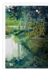
EL AGUA PURA DE MI POBREZA NEGRI, ADA